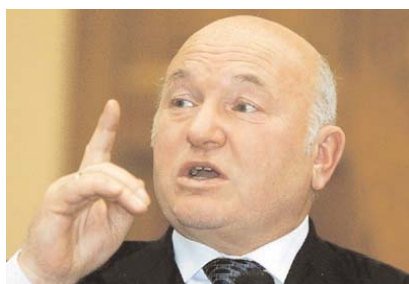
Мэр Москвы Юрий Лужков