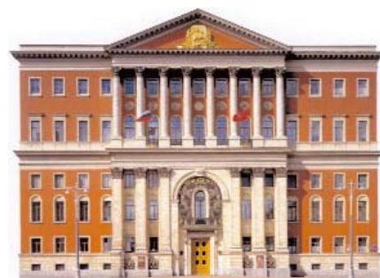
Здание городской мэрии

TANDBERG – мировой лидер в области производства оборудования для видеоконференц-связи (ВКС) высокой четкости, решений телеприсутствия и мобильных систем видеосвязи. У компании две штаб-квартиры: в Нью-Йорке и Осло. TANDBERG создает, разрабатывает и продвигает на рынок оборудование и программное обеспечение для аудиосвязи, видеосвязи и передачи данных. Компания занимается поставкой и обслуживанием оборудования для видеосвязи более чем в 90 странах мира. Больше информации – на сайте www.tandbergussia.ru .