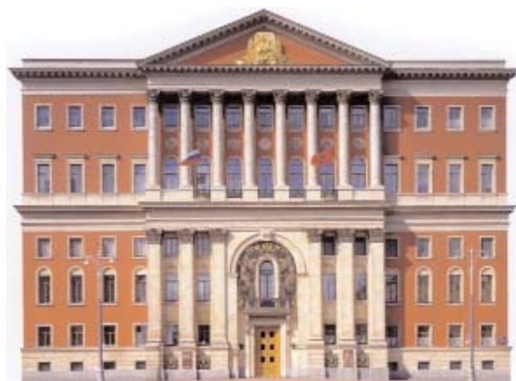
Здание городской мэрии

Около 175 кабинетов Московского правительства оборудовано